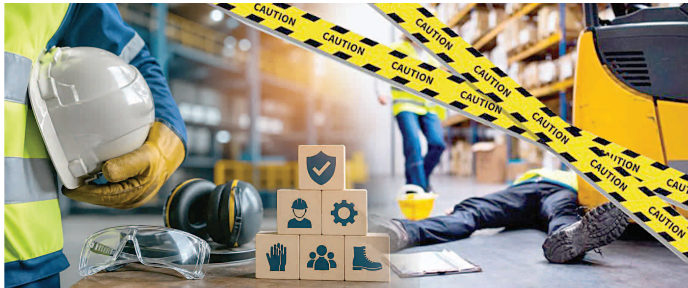
Өңір БАЛТАҚЫЗЫ (КОЛАЖ)

Қазақстанда жұмыс орнындағы жазатайым оқиғалар және өндірістік жарақаттану мәселесі өткір тұр. Бұған қоса, жұмыс берушілердің оны жасыру фактілері тіркелген. Сондықтан Президенттің тапсырмаларын орындау мақсатында Үкімет өндірістегі еңбекті қорғау жүйесін нығайтатын реформаларды бастады. Бұл жұмыс өндірісте зиянды және қауіпті жағдайларда жұмыс істейтін 479 мың қызметкерді қамтитын іс-шаралар кешенінен тұрады. Бүгінге дейін жасалған жұмыстар не берді және алдағы уақытта еңбек жағдайын жақсарту үшін қандай нақты қадамдар жасалады?